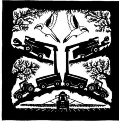
Pie-grièche grise Lanius excubitor

Patrimoine >> C'est, avec le bouquetin, l'un des symboles des Alpes, voire de la Suisse. Essentiellement présent dans les cantons du sud du pays (Grisons, Tessin, Valais, Uri), le «rat des Alpes» est une espèce adaptée à la vie souterraine. Il hiberne souvent en famille afin de profiter de la chaleur des autres individus. Cette description concerne bien sûr... la marmotte ( Marmota marmota ), l'un de nos emblèmes nationaux. Cette sympathie bestiole dont nous imitons tous le comportement sagace à l'approche de l'hiver fait partie des 413 espèces sauvages recensées sur notre territoire par l'Office fédéral de l'environnement. Or, qui dit espèce sauvage dit espèce menacée. Extension des zones urbaines, industrielles et agricoles, développement des activités touristiques et sportives tous azimuts... font partie des risques touchant les habitats naturels, le «garde-manger» et les corridors biologiques nécessaires à la survie de cette faune, grande ou petite.