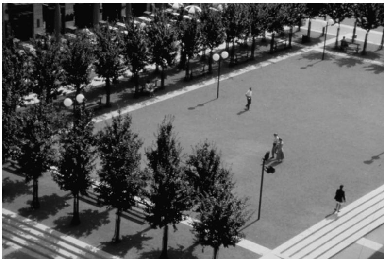
Fig. 13.3 La place Antonin Poncet (Photo J. Léone / Grand Lyon).

Ce vocabulaire n'est pas figé. Il évolue et s'enrichit constamment des apports des concepteurs et à l'occasion de chaque nouveau projet. Il a été bâti en partant de l'histoire et de la culture de l'agglomération lyonnaise en s'appuyant sur les couleurs particulières du Rhône et de la Saône. Le souci de simplicité et l'adoption d'une gamme restreinte de matériaux de sol et de mobilier constituent ses deux grands principes. Il s'agissait, en restreignant la gamme des matériaux mis en œuvre, de rompre avec l'emploi banalisé d'une multitude de revêtements qui contribuent à complexifier et à rendre proprement illisible des lieux aménagés. A contrario, une gamme restreinte renforce l'unité et la lisibilité des lieux. Si, de plus, le choix favorise les matériaux en rapport avec la culture et l'histoire, la démarche participe, alors, à réinvestir l'identité profonde des espaces.