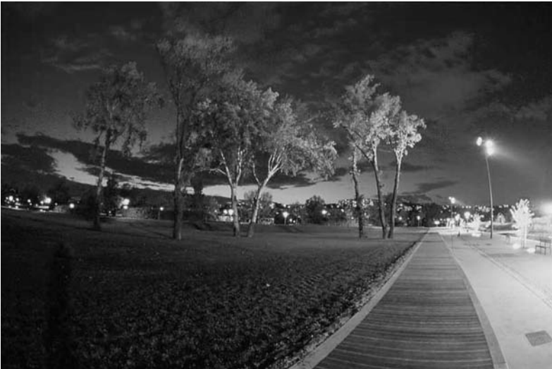
Fig. 6 Parc de Gerland, Lyon. Concepteur Michel Corajoud. Concepteur lumière Laurent Fachard.