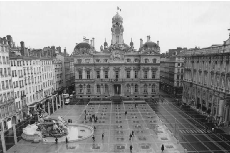
Fig. 10 Les Terreaux, Lyon. Concepteurs Daniel Buren et Christian Drevet.