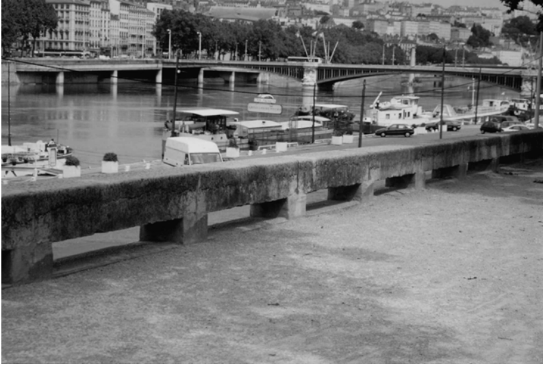
Fig. 15.3 Quai Victor Augagneur (photo J. C. Galléty).

La culture fonctionnelle aboutit souvent à des réponses monofonctionnelles car elle sélectionne les besoins auxquels elle doit apporter des réponses. Rappelons encore que la pensée fonctionnaliste a souvent banni toute démarche décorative car elle considère que la technique doit s'afficher comme telle et que le matériau ou la fonction sont esthétiques.