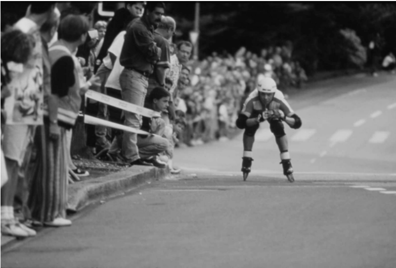
Fig. 4.1 International Roller-Contest à Lausanne.

Les phénomènes urbains tels que la « Street-Parade » à Zurich, l'« International Roller-Contest » à Lausanne, le «Reichstag voilé» à Berlin et «l'illumination scénique» des espaces publics à Lyon témoignent du pouls accéléré des espaces urbains. Ce changement de rythme affecte à la fois les rapports réels et imaginaires à l'urbain de ceux qui découvrent et pratiquent la ville mais aussi, et surtout, de ceux qui la pensent et la construisent. Ainsi, les concepts et les représentations qui, dans le passé, ont guidé l'élaboration de grands projets urbains ne sont plus aptes à répondre à la réalité urbaine enchevêtrée et complexe d'aujourd'hui.