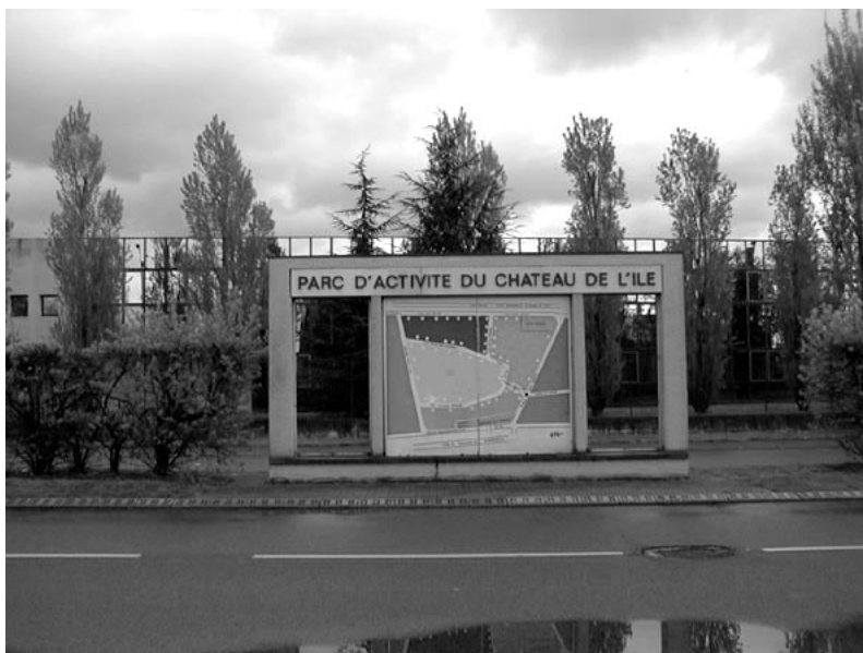
Fig. 16.4 Un point I à Feyzin-Vallée de la Chimie.