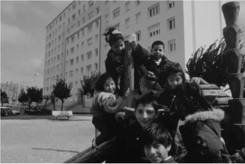
Fig. 11 Les adolescents aux Plantées à Meyzieux. L'observation des différentes tranches d'âges. Photo J. Léone, service DSU-Grand Lyon (sd).