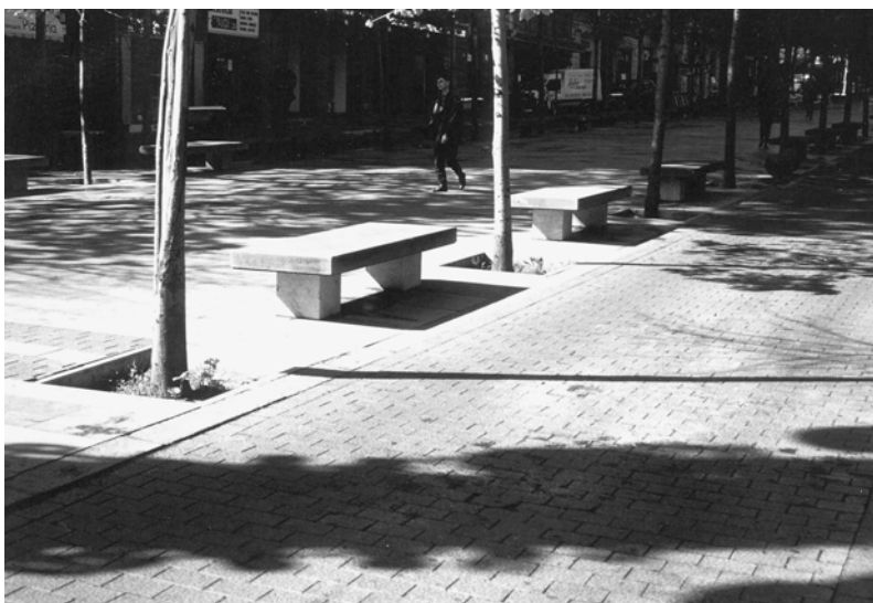
Fig. 15.4 Avinguda de Gaudi.