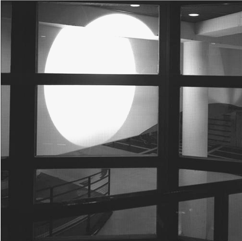
Fig. 14.4 Parc Croix Rousse – architectes J. Thomas et J. M. Wilmotte ; artiste M. Verjux