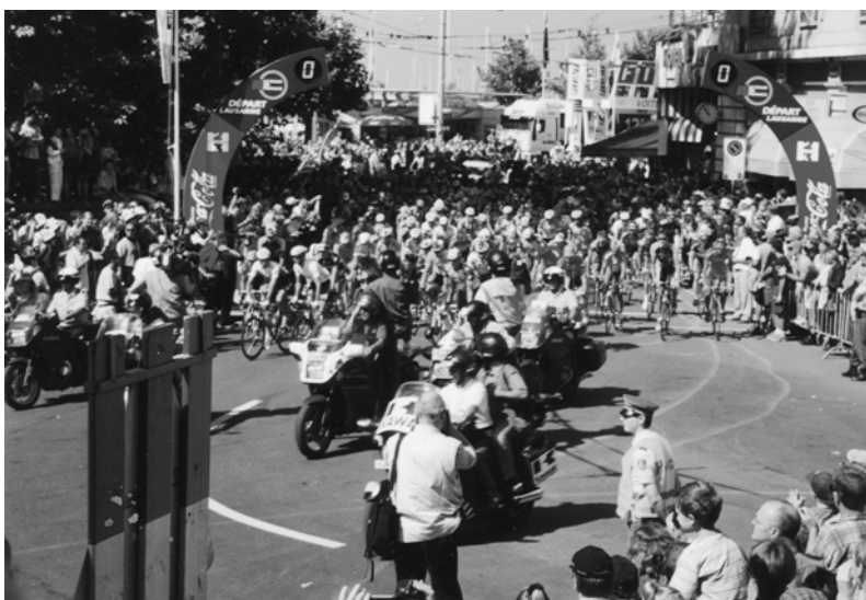
Fig. 4.6 Tour de France à Lausanne, juillet 2000.

Mais ces deux exemples ne sont que les «prototypes» d'un phénomène de festivalisation plus général. Les responsables communaux chargés de la gestion des places publiques organisent ou favorisent l'organisation de toutes sortes de fêtes, festivals ou spectacles qui peuvent contribuer à l'animation de cet espace (par exemple à Lausanne : la fête de la Bière, les présentations de mode, les spectacles des rollers, etc.).