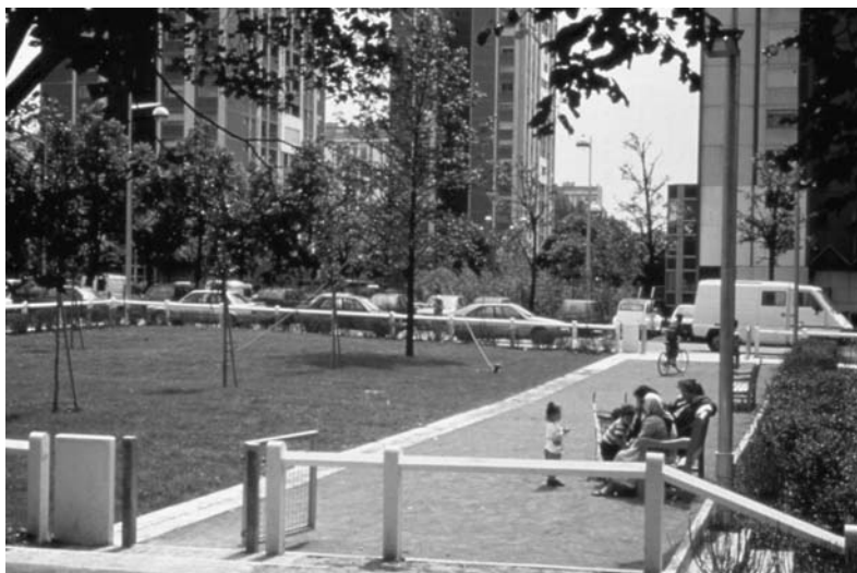
Fig. 13 Organisation de l'espace résidentiel, les jardins en pied de tours. Darnaise, Vénissieux. Concepteur Alexandre Chémétoff.