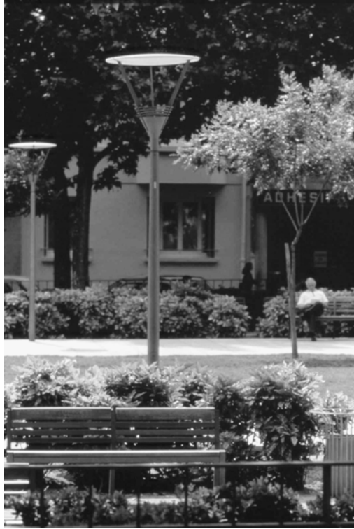
Fig. 13.4 Mobilier urbain, place Bir Hakeim.

Ce vocabulaire d'aménagement développe également quelques règles simples comme :