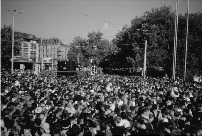
Fig. 4.5 Streetparade à Zurich, août 2000.

de se présenter aux yeux des spectateurs, crée un espace qui est avant tout une scène publique. Les équipements de la place sont donc des coulisses pour une pièce de théâtre dont le scénario n'est pas écrit. Cet endroit favorise la danse macabre de ses acteurs et constitue ainsi le lieu de fabrication des identités secrétées par les «masques» présentés par les citoyens [V. Flusser, 1995].