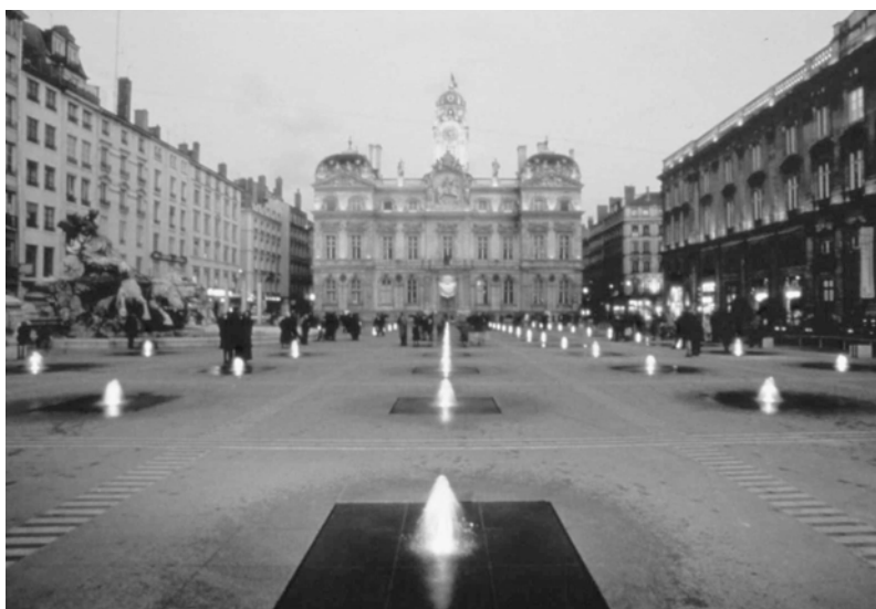
Fig. 13.2 La place des Terreaux.

Devant ce constat et le sentiment que les espaces publics pouvaient et devaient constituer un des outils de la recomposition et de la qualité urbaine, une politique de requalification a été lancée dès 1989 par l'équipe politique en place à «la Communauté Urbaine de Lyon». Plusieurs principes ont fondé cette politique. Tout d'abord, un principe de solidarité pour que l'aménagement des espaces publics contribue à la construction d'une agglomération plus homogène composée de quartiers solidaires : les centres des villes comme les grands ensembles, les espaces «majeurs» qui bénéficient à tous et ceux aménagés pour les riverains dans les cœurs des quartiers. Ensuite, un principe de modernité pour que le traitement de chaque espace traduise la ville de notre temps et en intègre toute la complexité. C'est l'appel à la création qui va permettre l'expression de cette modernité grâce à l'intervention systématique de concepteurs. Ce principe s'accompagne d'un autre, corollaire indispensable pour «continuer» harmonieusement la ville : le principe du respect de l'identité et de la mémoire des lieux. Enfin, et pour que ne soit pas constituée une suite de sites étrangers les uns aux autres, la politique des espaces publics repose aussi sur un principe d'unité. Un «vocabulaire urbain» a été défini. Il doit permettre d'orienter l'aménagement selon une direction commune à tous les espaces de l'agglomération.