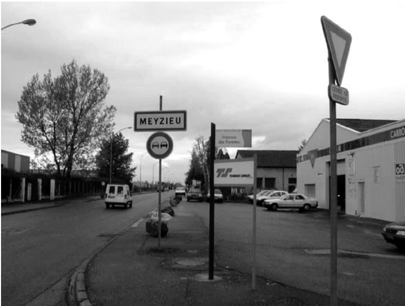
Fig. 16.6 Adressage dans la Zone Industrielle de Meyzieu.

L'idée d'expositions synthétiques sur les activités du site industriel pour en marquer l'entrée a été évoquée. Mais elle n'a trouvé aucune concrétisation aujourd'hui.