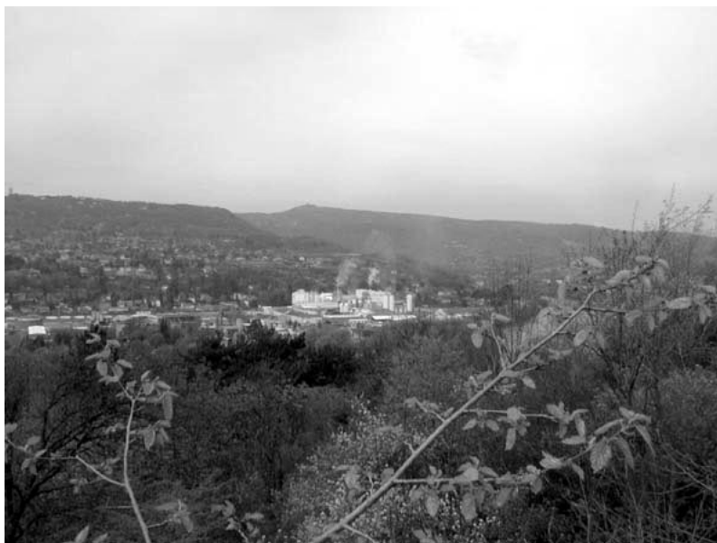
Fig. 16.1 Zone Industrielle de Collonges-au-Mont-d'Or (photo B. Lense).