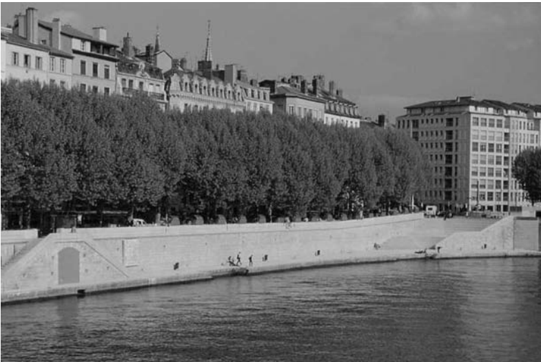
Fig. 8 Quai de la Pêcheurie (Saône), Lyon. Concepteur Catherine Blaise. Photo J. Léone, Grand Lyon, 1992.