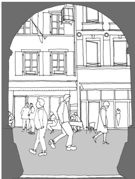
Fig. 12.3 Porte d'entrée de la place de la Palud.

signalisation artificielle (panneaux d'indication, plans de situation, etc.) et augmenter la facilité avec laquelle il est possible d'appréhender une entité spatiale urbaine. Cette approche analytique se fonde par ailleurs sur les travaux de Lynch [1960]. Elle permet de prendre en compte l'étroite liaison entre la dimension architecturale et les dimensions sociale et politico-administrative de la place publique urbaine.