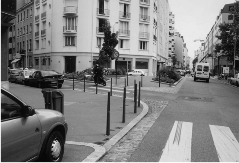
Fig. 15.2 Rue Juliette Récamier.

des formes. Pour clarifier le débat, il faut opposer deux grands courants de pensée dans la conception de l'espace public : l'approche fonctionnaliste et l'approche environnementaliste. Et nous voudrions montrer ici que la Communauté Urbaine de Lyon, dans nombre d'aménagements, ne s'est pas encore tout à fait détachée de la première.