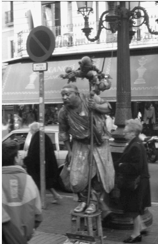
Fig. 4.3 Comédien de rue à Barcelone.

Ces phénomènes sociaux témoignent d'une transformation profonde de la société urbaine quant à l'utilisation des espaces publics. Jusqu'alors, la fonction principale de la plupart des espaces publics était de gérer les flux de circulation, même si certaines places publiques présentent une diversité d'usage plus grande (marchés, noyaux de rencontre, etc.) compte tenu de leur cadre architectural plus riche. Les changements de pratiques sociales apparus avec la «société de loisirs» ont placé la question des espaces publics au centre des réflexions sur le développement urbain. De plus en plus d'espaces publics sont devenus stratégiques pour la mise en scène de l'urbain puisque censés satisfaire un nombre croissant d'utilisateurs qui souhaitent consommer du «public».