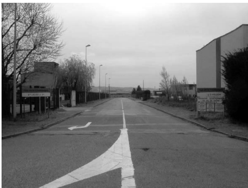
Fig. 16.2 Zone Industrielle de Lyon-Nord-Val de Saône.