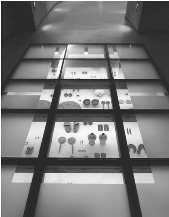
Fig. 14.2 Parc des Terreaux – architectes P. Favre et J.M. Wilmotte ; artiste Matt Mullican.

L'intervention des artistes constitue la partie émergée de l'iceberg. Les réflexions initiales menées par Lyon Parc Auto avec l'assistance d'Art-Entreprise 6 ont conduit à repenser les concepts de «client» et de «service».