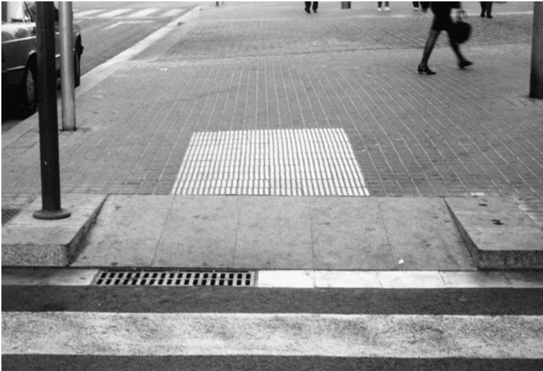
Fig. 15.7 Plan incliné sur le trottoir.

Afin d'interdire l'accès de l'espace central aux voitures, on a utilisé une alternance d'arbres d'alignement, de candélabres et de bancs. A Barcelone, on a l'habitude de regrouper le plus possible toutes les «émergences» que l'on trouve sur l'espace public selon une ligne parallèle à la bordure de trottoir. Ici, cette ligne est constituée d'objets qui ont leur valeur esthétique ou leur valeur d'usage indépendamment de l'effet anti-stationnement. Les arbres sont ici pour introduire le végétal dans la rue, les candélabres sont choisis pour leur qualité plastique et les bancs sont là pour l'appropriation humaine. Les bancs sont constitués de dalles de pierre simplement posées sur des blocs. Certes, il y a beaucoup plus de bancs qu'il n'y en a besoin. Mais la démarche environnementale s'illustre parfaitement ici. On a voulu éviter d'introduire sur l'espace public des dispositifs – les potelets, les bornes – qui n'auraient renvoyé au regard que leur fonction technique. On a voulu au contraire parer l'espace d'objets qui renvoient une image esthétique, une image sociale. Leur fonction technique est dissimulée dans leur image première.