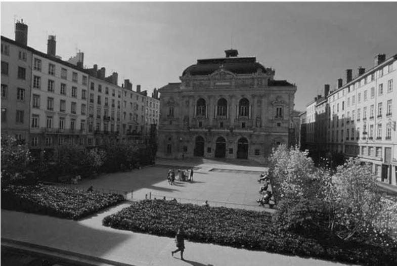
Fig. 4 Place des Célestins, Lyon. Concepteurs Michel Desvignes, Christine Dalnoky. Photo J. Léone, Grand Lyon, 1995.