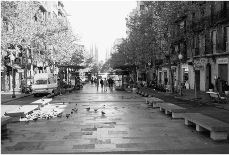
Fig. 15.5 Avinguda de Gaudi.

à ne pas réaliser l'échangeur routier qui aurait dû être là, pour lui substituer un édifice urbain qui apparaît comme un acte architectural en soi. Les voies d'accès sont incorporées dans une sorte d'immense amphithéâtre qui n'est pas sans rappeler de l'extérieur les arènes, et l'espace central est... un jardin que traversent plusieurs voies piétonnes. Il y a donc une démarche plastique, environnementale, qui a consisté à gommer l'aspect et le dessin technique pour lui substituer une forme qui existe par elle-même et lui donner une ambiance qui se réfère aux édifices de la ville, l'arène, le jardin et non pas aux espaces habituels de l'infrastructure routière.