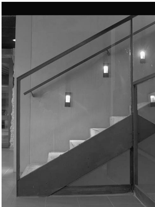
Fig. 14.1 Parc de la République – architectes, P. Vurpas et J. M. Wilmotte (photo A. Morin).

«domicile Presqu'île 4 » a été créé. En revanche, aucune action efficace n'a pu être mise en œuvre sur la voie publique. En effet, le dispositif légal est parfaitement inadapté à la situation. Le montant des amendes est réduit. L'effet dissuasif des amendes est de plus amoindri par une large impunité. Enfin, l'inadaptation du statut du personnel chargé de la verbalisation n'aide pas à résoudre le problème.