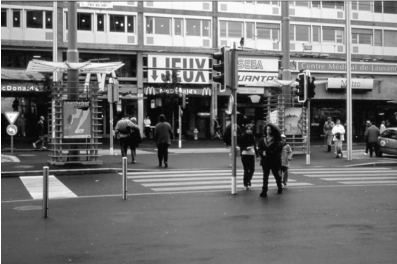
Fig. 4.7 La Place de la gare à Lausanne.

Il s'agit donc d'une tendance et d'un potentiel fortement ambivalent qui d'un côté, prend en compte la demande du citoyen contemporain pour une animation plus stimulante et qui de l'autre côté, entraîne une ségrégation accrue. Cette dernière se manifeste surtout parmi ces groupes d'utilisateurs qui ne sont pas conformes à l'image de la «gentrification» de la place publique.