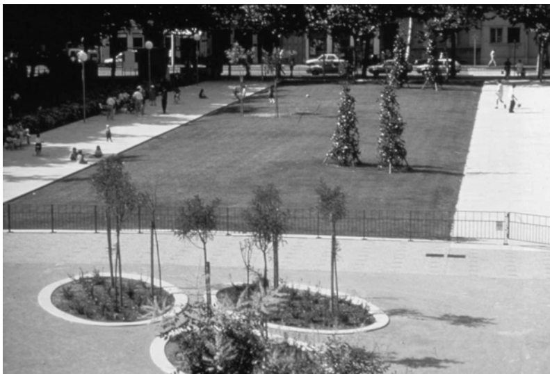
Fig. 13.5 La place Bir Hakeim.

On pourrait penser que ce vocabulaire constitue une entrave à la créativité des concepteurs. L'expérience montre qu'il contribue plutôt à l'exacerber. Dans tous les cas, le débat reste ouvert et les concepteurs utilisent tout ou partie de ce vocabulaire. Mais c'est toujours la pertinence du projet qui permet au concepteur de justifier et de faire accepter telle ou telle disposition, revêtement ou mobilier spécifique différent de celui proposé par le vocabulaire des espaces publics. Parmi ces justifications, les particularités du site sont souvent utilisées.