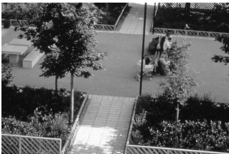
Fig. 14 L'espace central du quartier Saint-Jean à Villeurbanne. Concepteur Alain Marguerit.