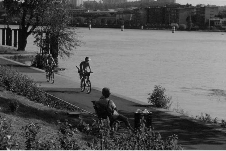
Fig. 7 Plan Bleu (Rhône), Lyon. Photo J. Léone, Grand Lyon, 1995.