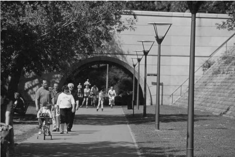
Fig. 2 Berges du Rhône, Lyon.