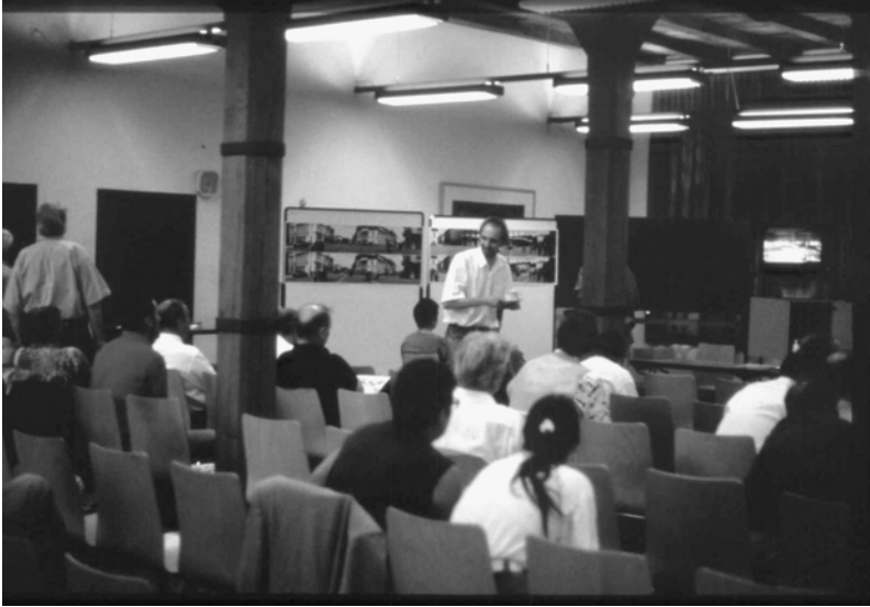
Fig. 4.4 Forum de négociation à Winterthur, Suisse.

Depuis le début des années quatre-vingt, les professionnels de l'espace essaient de répondre à la réalité urbaine en transformation par la mise en place de processus de planification interdisciplinaires, censés rendre plus intégralement compte de la complexité des phénomènes urbains contemporains.