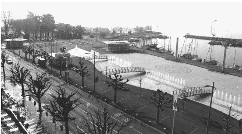
Fig. 4.2 Place de la Navigation, Lausanne 2 .

En second lieu, il s'agit d'exprimer certains phénomènes contemporains qui contribuent à souligner des réalités sociospatiales que l'on observe aujourd'hui. Les phénomènes de la « théâtralisation », de la « festivalisation » et de la « commercialisation » apparaissent comme particulièrement évocateurs et autorisent une meilleure définition de la notion récurrente du discours sur l'urbain, à savoir celle de l' urbanité .