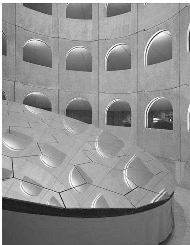
Fig. 14.3 Parc des Célestins – architectes, M. Targe, J.M. Wilmotte ; artiste, D. Buren.

Les enquêtes de satisfaction réalisées chaque année par Lyon Parc Auto auprès de ses clients ont montré que les principales demandes concernaient la facilité d'accès aux parcs, leur lisibilité, leur confort et, enfin, leur sécurité. Ce dernier point, qui faisait l'objet de travaux au sein de la société depuis 1985, a pu être intégré lors de la construction des nouveaux parcs. Une réflexion menée simultanément sur le rôle de l'architecture et sur celui de l'art dans la construction de la Ville a conduit à constituer des équipes pluridisciplinaires, chargées de réaliser des ouvrages correspondant plus aux attentes du public.