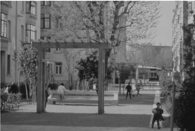
Fig. 12 Requalification des cheminements résidentiels dans le quartier des Etats-Unis. Les habitants ont obtenu le maintien et la récréation du mobilier d'origine conçu par Tony Garnier. Concepteur Agence Ilex.