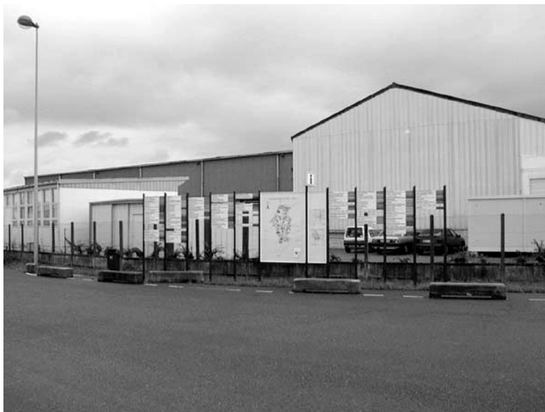
Fig. 16.3 Un point I simplifié, Z.I. Meyzieu-Jonage.

Le point d'information ou point I est un élément primordial dans la signalétique. Il est le point de départ. Il fixe dans le même temps les règles du jeu. Pour ce faire, le mode de repérage s'appuie sur :