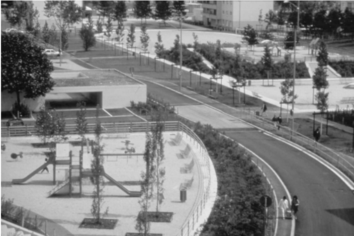
Fig. 13.1 Décines, le Prainet (Photo G. Dufresne).

Dans la continuité d'une prise de conscience amorcée au début des années 1980, un constat clair a été dressé à la fin de cette même décennie sur l'état général des espaces publics de l'agglomération et sur les causes de cette situation. Celle-ci était caractérisée par des aménagements de piètre qualité à la fois du point de vue des usages et du point de vue formel. Ces aménagements obéissaient essentiellement à des logiques techniques pures, permettant de répondre surtout aux besoins fonctionnels liés à un seul mode de déplacement, la voiture particulière. Ils étaient souvent l'objet d'interventions successives, par strates, indépendantes les unes des autres, débouchant sur des contradictions d'usages, des espaces vides de sens qui n'étaient plus des lieux supports de vie sociale. Les aménagements se dégradèrent malgré la qualité paysagère exceptionnelle des sites de l'agglomération, malgré la richesse et la diversité culturelle rencontrées dans les villes de l'agglomération, dans les quartiers, malgré les traces et la mémoire d'une histoire toujours présente.