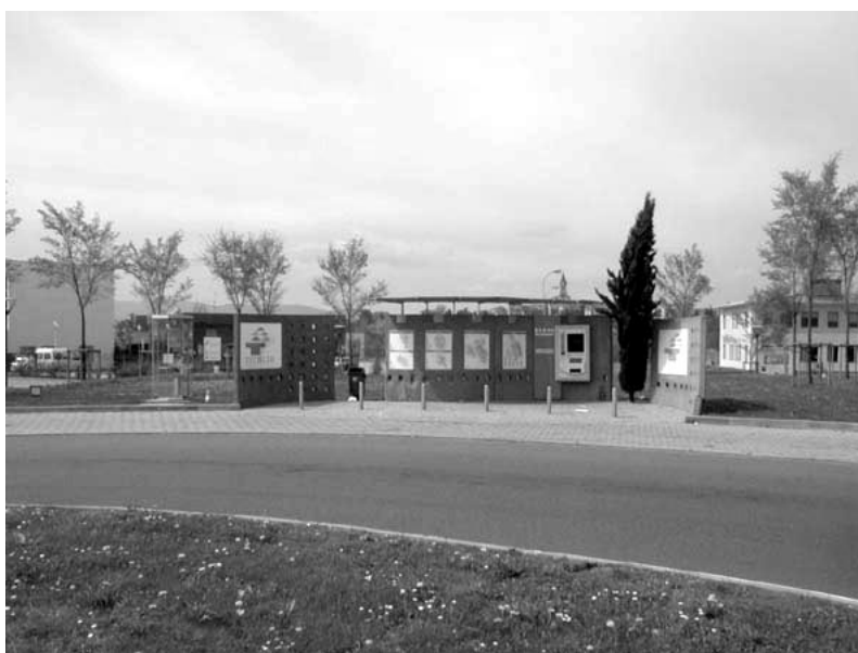
Fig. 16.5 Un point I à Dardilly-Techlid.