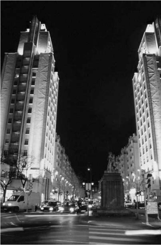
Fig. 5 Avenue Henri Barbusse, Villeurbanne. Concepteur Alain Marguerit. Photo J. Léone, Grand Lyon, 2000.