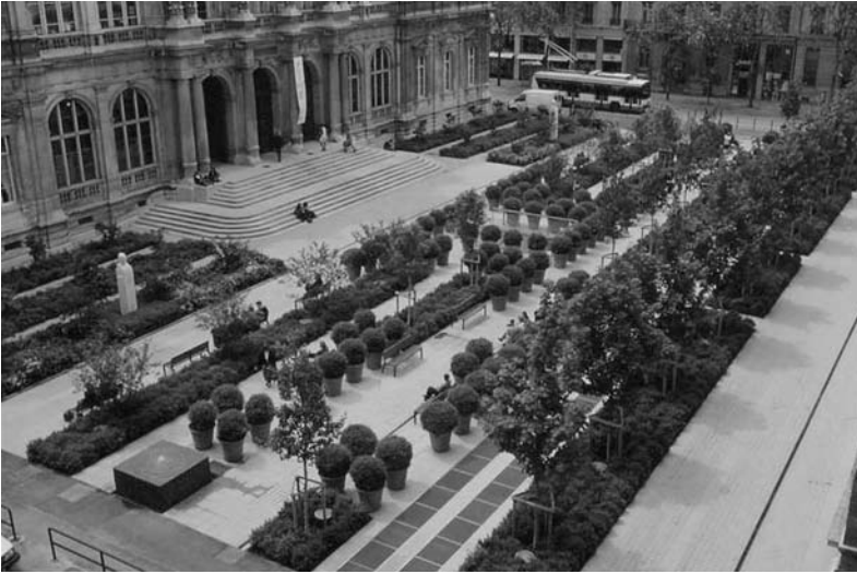
Fig. 3 Place de la Bourse, Lyon. Concepteur Alexandre Chemetoff. 1993.