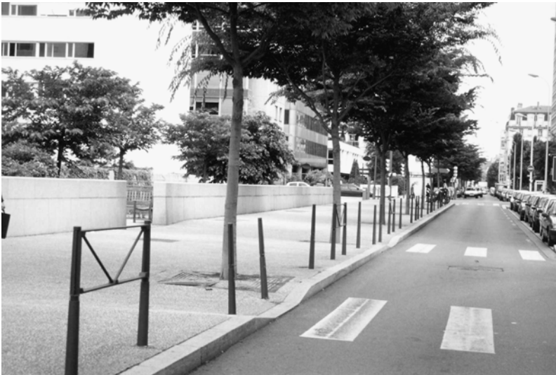
Fig. 15.8 Rue Duguesclin.

Ainsi le Grand Lyon doit être reconnu par la qualité du traitement de ses espaces publics. Mais si les méthodes et les moyens sont à la hauteur des enjeux concernant ce que l'on pourrait appeler «les grands espaces», de nombreuses carences restent présentes lorsqu'il s'agit des espaces mineurs, des espaces banals qui n'ont pas fait l'objet d'une réflexion approfondie. Les manques existent au plan conceptuel car il n'existe pas de véritable ligne d'action coordonnée concernant ce type d'espace. Mais les manques existent aussi au plan organisationnel car le traitement au jour le jour de ces petits dysfonctionnements sur l'espace public relève aussi, pour une part, des subdivisions territoriales qui n'ont pas forcément intégré une culture de la qualité globale.