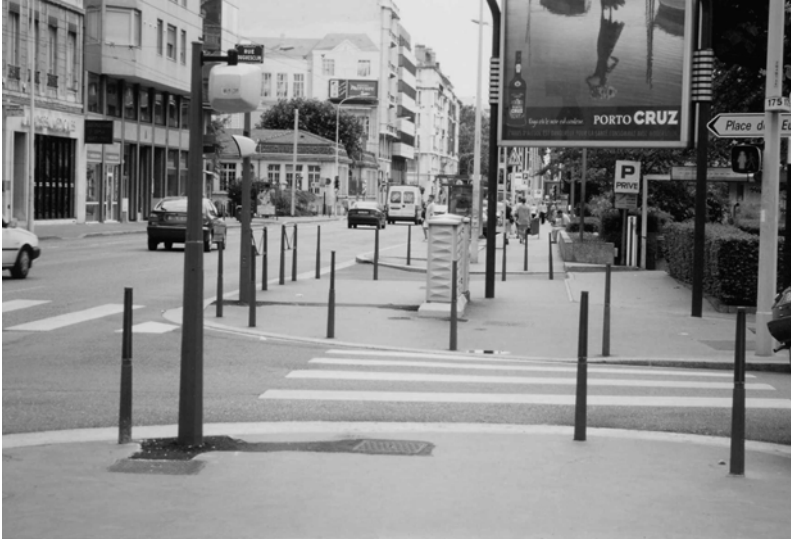
Fig. 15.1 Cours La Fayette.