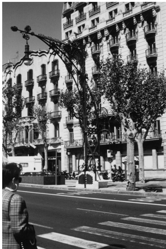
Fig. 15.6 Paseo de Gracià – Lampadaire de Pere Falquès – 1906.

Venons-en maintenant, à l'autre bout de l'échelle, là où la défense des espaces du piéton est nécessaire pour lutter contre le parasitage de son milieu par le stationnement sauvage.