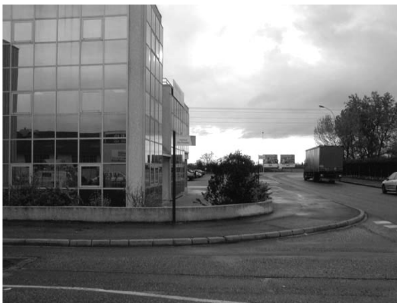
Fig. 16.7 Détail de l'adressage dans la Zone Industrielle de Meyzieu.

La prise en compte optimale des besoins, sinon des attentes des usagers ainsi que la création d'une image de marque commune à l'ensemble de l'agglomération lyonnaise sont les deux axes stratégiques forts qui sous-tendent l'expérience du Grand Lyon. L'image de marque a pour objet de fédérer l'ensemble des initiatives en termes de signalétique. Elle fonctionne un peu sur le modèle du vocabulaire des espaces publics. Si elle n'entrave pas la nécessaire référence aux conditions locales de mise en œuvre, elle permet de disposer d'un référent sur l'ensemble de l'agglomération. Toutefois, ces deux axes stratégiques nécessitent des études assez longues, ce qui freine la mise en œuvre d'une signalétique cohérente sur l'ensemble de l'agglomération.