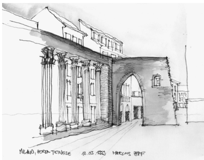
Fig. 12.4 Piazza Ticinese (Milan), traces du passé.

L'identité désigne – suivant la définition usuelle – le caractère stable d'un objet ou d'une personne (état d'une chose qui demeure toujours la même 3 ). Ce caractère permanent constitue généralement un élément de repérage. Cependant, la théorie de «l'idéalisme dialectique» (Platon, Hegel) part du principe que l'identité d'une chose est temporaire. Or l'identité est, d'une part, relative à l'époque dans laquelle elle a été construite et dépend, d'autre part, de son créateur (l'individu ou la collectivité). Manuel Castells [1997] met en évidence que les éléments qui composent l'identité 4 sont très divers (aspects historiques, géographiques, physiques etc.). Pour construire une identité spécifique, ces différents aspects seraient sélectionnés et un sens particulier leur serait réattribué. Sa codification sémantique dépend donc du contexte de la structure sociale, spatiale et temporelle.