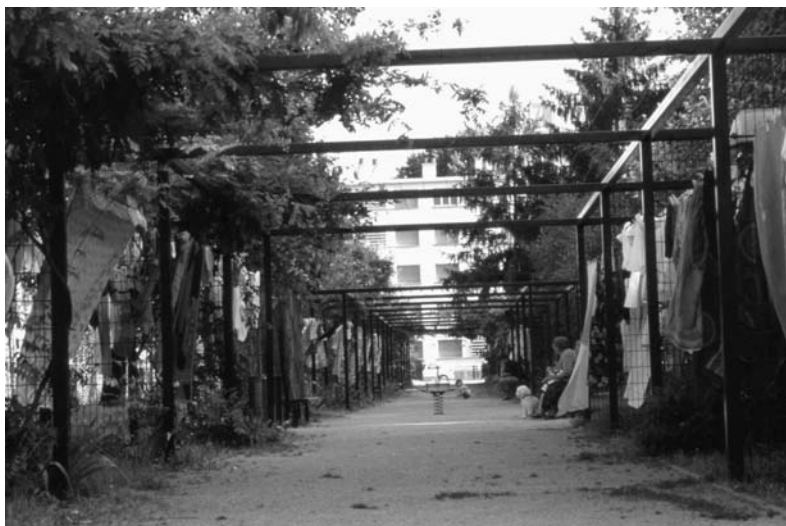
Fig. 15 Des séchoirs à linge au prix du paysage... Concepteurs Jalbert & Tardivon.