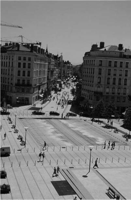
Fig. 9 Place et rue de la République, Lyon. Concepteur Alain Sarfati. Photo J. Léone, Grand Lyon, 1995.