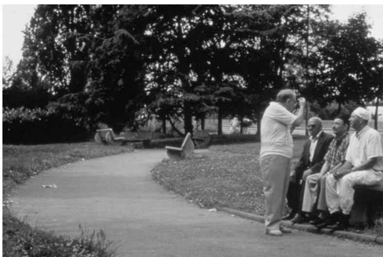
Fig. 16 Faciliter les formes spontanées de sociabilité. L'allée du square des 400 à la Sauvegarde. Concepteur Eric Pierre Meynard.