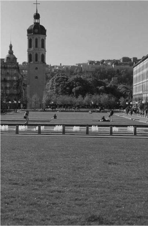
Fig. 1 Place Antonin Poncet, Lyon. Concepteurs Michel Bourne, Jean-François Grange Chavanis. Photo J. Léone, Grand Lyon, 1997.