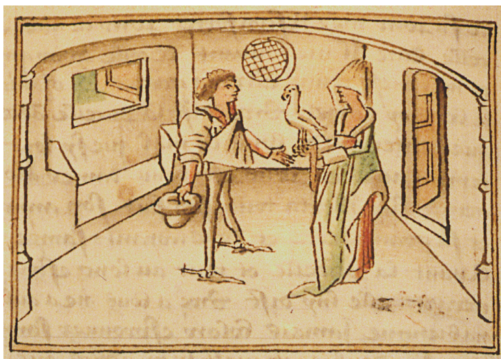
FIGURE 10 Une demoiselle donne à Gérard un épervier, Histoire de Gérard de Nevers (anonyme), Maître de Wavrin, vers 1460-1464.

la quête du héros plutôt qu'elle ne l'interrompt, en raison de son « attitude 39 », se pose bien en praticienne du care 40 dans le portrait qu'en fait le Maître de Wavrin (fig. 10).