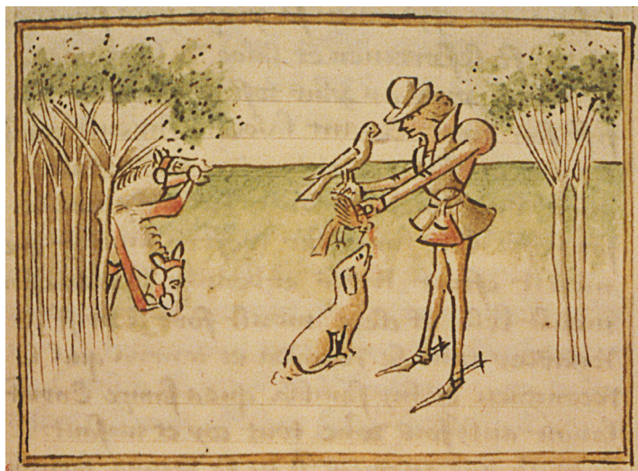
FIGURE 11 L'épervier de Gérard ramène l'anneau d'Euryant et Gérard retrouve la mémoire, Histoire de Gérard de Nevers (anonyme), Maître de Wavrin, vers 1460-1464. Bruxelles, KBR, ms. 9631, fol. 77.

Cette seconde rémission par l'amour est également mise en image par le Maître de Wavrin (fig. 11). On peut voir le chevalier, immobile, vivant une véritable épiphanie. Il tient le rapace à hauteur de son visage alors qu'il contemple la proie maintenue par les serres de l'oiseau. Il découvre la pierre, volée à Euryant par l'alouette désormais entre ses mains et qui, comme le prénom de la demoiselle dans la chanson de toile, fait office de remède miraculeux. De toute évidence, l'enlumineur ne traite pas de la même manière les différents types de blessures, guerrières ou amoureuses, ou les rémissions. Les unes sont effacées et les autres mises en image de manière symbolique. Il ne montre pas le visible, la blessure médicale ou le care en tant que soin apporté, mais l'invisible, le care en tant qu'état d'esprit. En dépit du rôle primordial de l'épervier pour la résolution de l'intrigue, ce sont davantage les paroles et l'attitude de la demoiselle que l'oiseau qu'elle lui confie qui permettent à Gérard de mûrir et de devenir un compagnon attentionné et véritablement aimant. Quoique de manière indirecte, le discours qui transparaît à travers les images