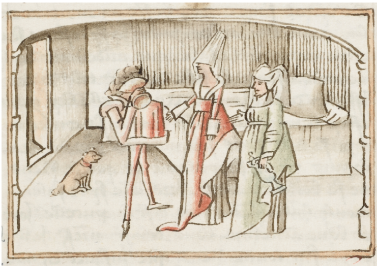
FIGURE 3 Gérard boit le philtre d'amour, Histoire de Gérard de Nevers (anonyme), Maître de Wavrin , vers 1460-1464. Bruxelles, KBR, ms. 9631, fol. 61.

La conséquence directe de ce rejet est la maladie d'amour, mais aussi la colère de la fille du duc au cours du chapitre suivant. Aigletine se plaint et se prétend malade d'amour, ce qui ne l'empêche pas d'entonner une chanson 15 . L'identité de la personne à laquelle elle s'adresse – celle qui serait en mesure de la soigner – n'est pas claire. Il est possible que cela soit Gérard, mais peut-être la chanson est-elle surtout destinée à sa vieille servante qui l'a déjà informée de sa capacité à préparer un philtre d'amour. D'ailleurs, c'est bien elle, déjà dans le verger, qui l'entend, l'écoute et accède à sa demande. Experte en amour et en pharmacopée, cette dernière entend répondre aux désirs de sa demoiselle et s'attelle immédiatement à la tâche. Notons que l'objectif poursuivi est avant tout sexuel – la vieille servante en fait son premier argument quand elle dit à Aigletine : « je feray tant pour vous que a loisir et a vostre aise arés tous voz plaisirs de luy » (XXVII, 12). Rien de cela n'est représenté par le Maître de Wavrin qui se concentre sur l'absorption du philtre d'amour et sur la transformation de Gérard (fig. 3).