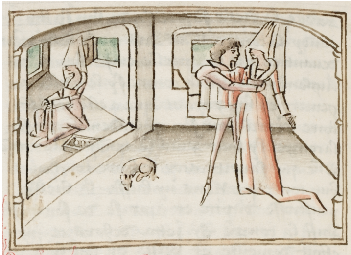
FIGURE 4 Gérard, pris d'amour pour Aigentine, Histoire de Gérard de Nevers (anonyme), Maître de Wavrin, vers 1460-1464. Bruxelles, KBR, ms. 9631, fol. 63v°.

Dans la miniature suivante (fig. 4), la distance entre la jeune femme et sa victime est annihilée. Le héros enlace Aigentine, la tenant par la taille, passionnément et de ses deux bras. Le Maître de Wavrin donne à voir les amoureux seuls au monde, l'hôte de Gérard et la servante n'étant pas représentés. C'est le point culminant de la séquence des miniatures mettant en scène le rapprochement d'Aigentine et de Gérard. Devenu amnésique, ce dernier oublie Euryant, mais c'est lui qui