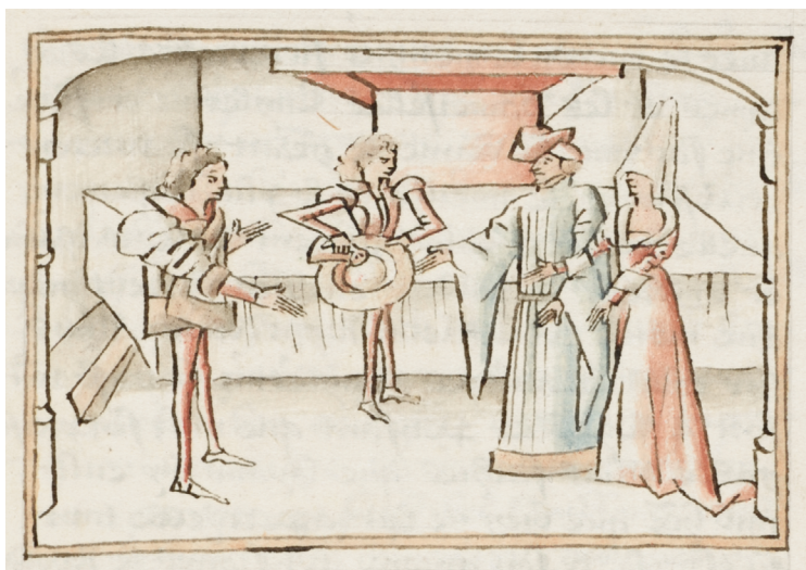
FIGURE 1 Première rencontre avec Aiglentine, Histoire de Gérard de Nevers (anonyme), Maître de Wavrin, vers 1460-1464. Bruxelles, KBR, ms. 9631, fol. 56.

nature excessive en fait une personnalité envahissante, dont la dangerosité transparait dans l'image et fait écho à la méchanceté qui la caractérise dans le texte 13 . À ce stade du récit, les pensées de Gérard sont toutes dirigées vers Euryant. Le prosateur souligne que le chevalier manque d'appétit et de joie de vivre. Il « ne chaloit gair de soy jouer ne esbatre » (XXVI, 9) et préfère s'isoler. Alors qu'il s'appuie à une fenêtre et entame une chanson d'amour (XXVI, 9-11), Aiglentine l'entend et le fait alors quérir, ce qui donne au Maître de Wavrin l'occasion de mettre en scène les deux jeunes gens dans une proximité organisée par Aiglentine (fig. 2).