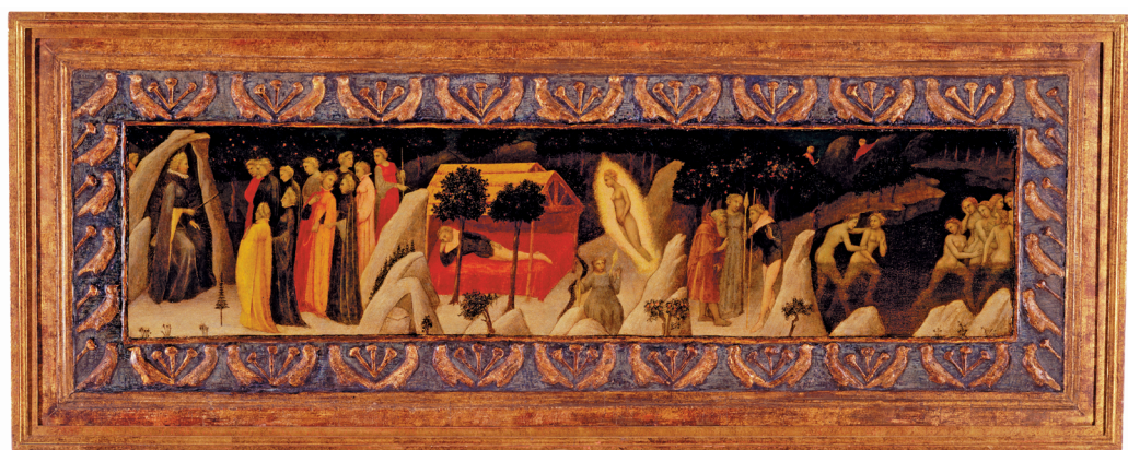
FIGURE 1 Fra Angelico, Scènes du Ninfale fiesolano de Boccace , v. 1415-1420, tempera sur bois, 28,9 × 126,5 cm. Bowdoin College Museum of Art, Brunswick (Me.), inv. n. 1961.100.1.

la jeune femme, dès la première réception du Ninfale , l'on privilégie la dimension amoureuse du récit. En témoignage, par exemple, les nombreuses représentations visuelles, à la fois dans les manuscrits et les objets d'artisanat 4 , qui ont accompagné le succès de l'œuvre notamment à partir du XV e siècle. Ces figurations reprennent les épisodes principaux de l'histoire, en mettant particulièrement en évidence la thématique amoureuse et en incluant la scène du viol. Pour prendre un exemple, le panneau antérieur d'un coffre en bois du XV e siècle attribué à Fra Angelico représente les scènes du Ninfale jusqu'au viol de Mensola (la suite de l'histoire n'est pas illustrée).