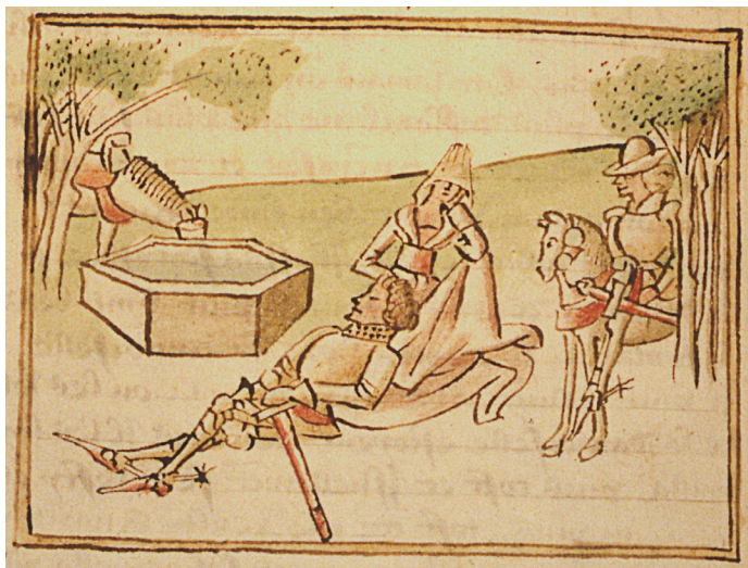
FIGURE 6 Gérard endormi sur le giron de la demoiselle, Histoire de Gérard de Nevers (anonyme), Maître de Wavrin, vers 1460-1464. Bruxelles, KBR, ms. 9631, fol. 88v°.

vulnérabilité totale 25 (fig. 6), alors que la rubrique du chapitre XXXIX, placée sous l'image, indique « [c]omment Gerars s'endormy ou geron de la faulse damoiseelle ». Gérard prend symboliquement la place du chevalier vaincu. Quoique sur le giron de la demoiselle, il occupe dans la composition la même position que le corps de son adversaire décapité (fig. 7) après le sauvetage de la Demoiselle au gant. Parallèlement à cela, l'enlumineur donne à voir Denise, rhabillée, arborant l'attitude du chevalier vainqueur mais blasé : assise, le coude reposant sur un genou pour soutenir sa tête (fig. 6). Sa position, tête baissée et « main a la maisselle », évoque la frustration sexuelle : elle n'a pas trouvé un adversaire à sa hauteur. La mise en image de l'épisode du repos du guerrier