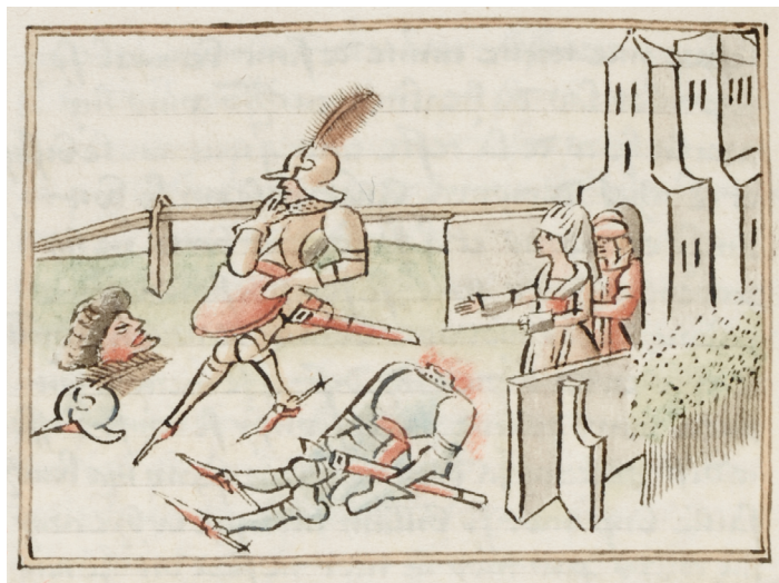
FIGURE 7 La Demoiselle au gant rejoint Gérard, vainqueur du combat, Histoire de Gérard de Nevers (anonyme), Maître de Wavrin, vers 1460-1464. Bruxelles, KBR, ms. 9631, fol. 37v°.

est conforme au texte 26 . Cependant, la proximité iconographique avec la miniature de Gérard vainqueur lors du sauvetage de la Demoiselle au gant et le renversement dont témoigne l'inversion des rôles sont significatifs de la position de victime de Gérard que l'enlumineur cherche ici à rendre visible. La sexualité est un piège dans lequel vient de tomber Gérard. Le Maître de Wavrin prépare le terrain et contextualise la prochaine péripétie : quand les lecteurs tournent la page, ils découvrent que Denise tente d'entacher sa réputation en le décrivant comme « le plus faulx et desloyal chevalier au monde, le plus crueulx que oncques nasquy de mere » (XXXIX, 4) et profite de sa vulnérabilité pour essayer de persuader l'écuyer qui apparaît dans l'image de le tuer.